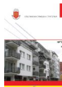
Две од осам до сада усвојених локалних стамбених стратегија