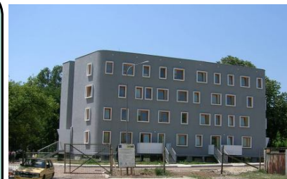
Ваљево. Општински станови за издавање

Предлог закона о социјалном становању (члан 2)