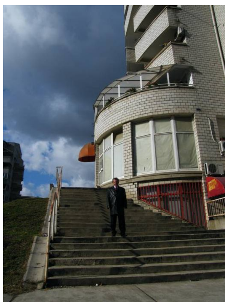
Београдски Фонд за финансирање солидарне стамбене изградње је изградио више од 8.000 станова, од оснивања 1990.