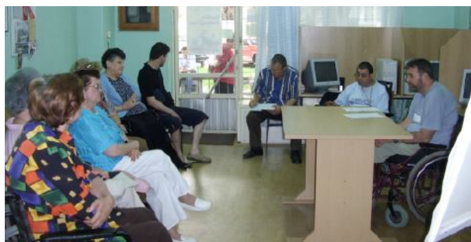
Фотографија са једне од дискусија

Реализацију пројекта Заговарање за укључивање рањивих друштвених група у националну политику социјалног становања омогућио је Институт за одрживе заједнице (ИСЦ), уз подршку америчког народа путем донације УСАИД-а бр. 169-А-0006-00104-00. Мишљења изнета у овом документу су изнета од стране аутора и нужно не одсликавају мишљење ИСЦ-а, УСАИД-а или Америчке владе.